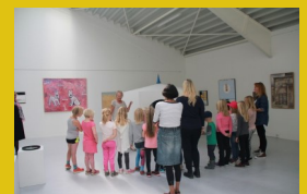
SFO afprøver sanserne

15. december orienteres Varde kommunes kunstudvalg om projektet på et møde i Janus Bygningen.