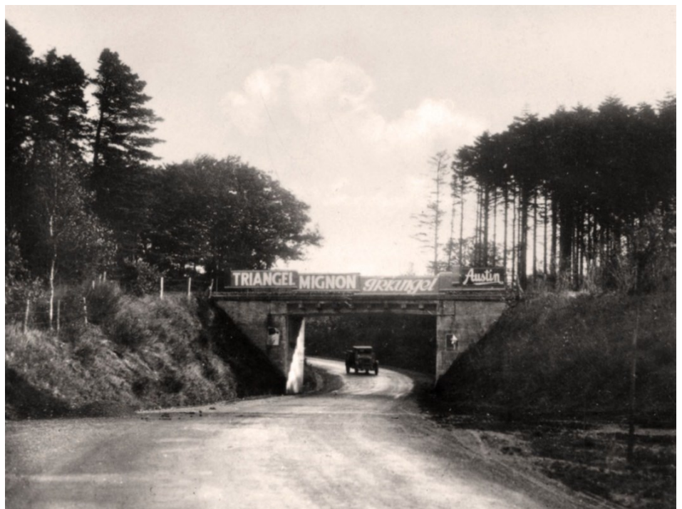
Den stemningsfulde viadukt under baneløbet ved Tistrup.

knappes op, og den lugtede så godt af benzin.