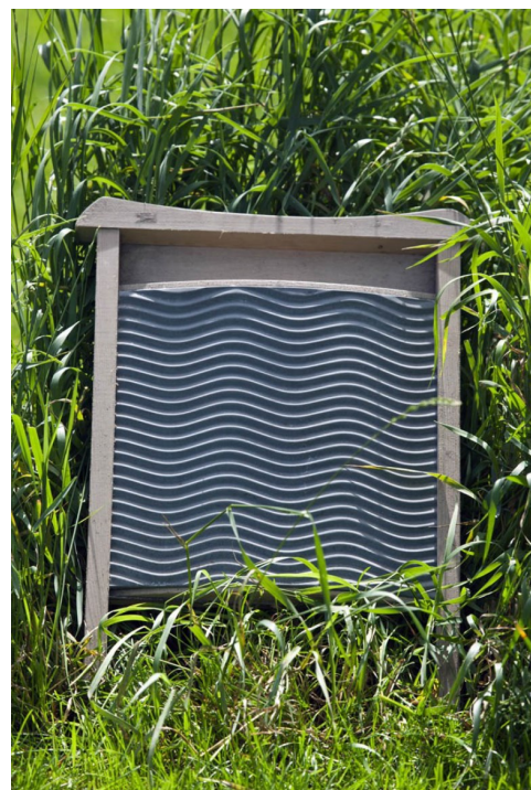
Datidens vaskemaskine - Bedstemors vaskembrædt, som al tøjet blev gnubbet imod efter iblædsætning og kogning i gruekedel.

Bedstemor var bl. a. vaskekone i Tistrup - her titter hun frem under det rene tøj.