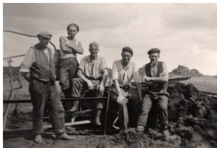
Min far måtte skifte dress code, da Brødrene Knudsens Forlystelsespark blev opløst. Her ses han i midten i en pause under tørvegravning ved Sno-rup.