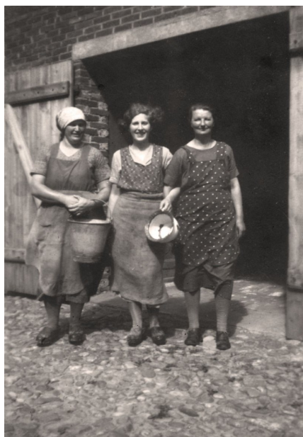
Tre gratier, muligvis v. Lunderup Hovedgård. Til venstre Bedstemor, der var en af malkepigerne. De to andre og fotografen er ukendte.