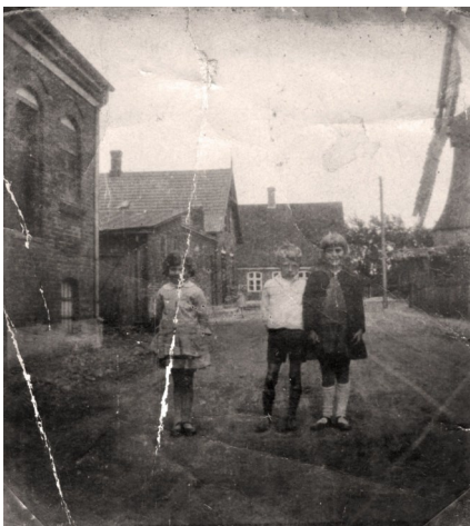
Gammelt billede af kvarteret omkring Tistrup Mølle - børn og fotograf ukendt

Vi kørte ned gennem Storegade og oppe til højre efter hotellet, pegede han op over en skråning og fortalte, at min mor og far havde boet der, efter at de var blevet gift i 1943. De boede ligeledes til leje ovenpå i en villa (som har indgang fra Møllegade idag)