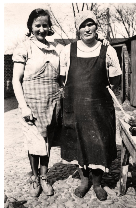
Bedstemors arbejde var påskønnet og hun fik en velfortjent opbakning efter en klage over hendes storvaskearbejde.

Hun var for det meste kogekone og vaskede også storvask for andre, også forefaldende arbejde ude på landet deltog hun i f. eks roehakning om sommeren og kartoffelopgravning om efteråret, alt imens hun uophørligt sang de gamle folkeviser og sange.