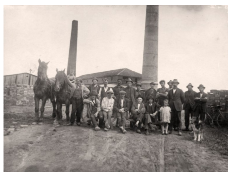
Hesselho Teglværk med personale, børn, heste og hund. Bedstefar med store muskler og korslagte arme. De andre og fotografen er ukendte.