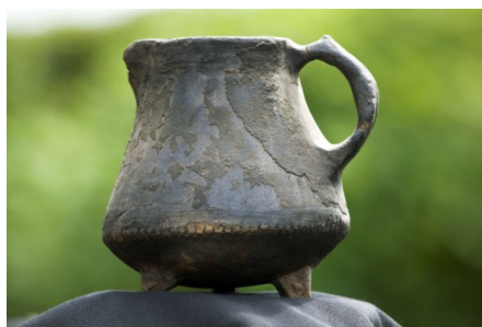
Den smukke sorte lerkande, som min far fandt ved tørvegravning i Snorup under krigen.