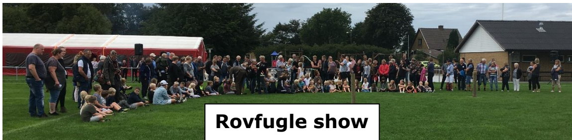
Foto fra årets Landsbyfest i Lunde