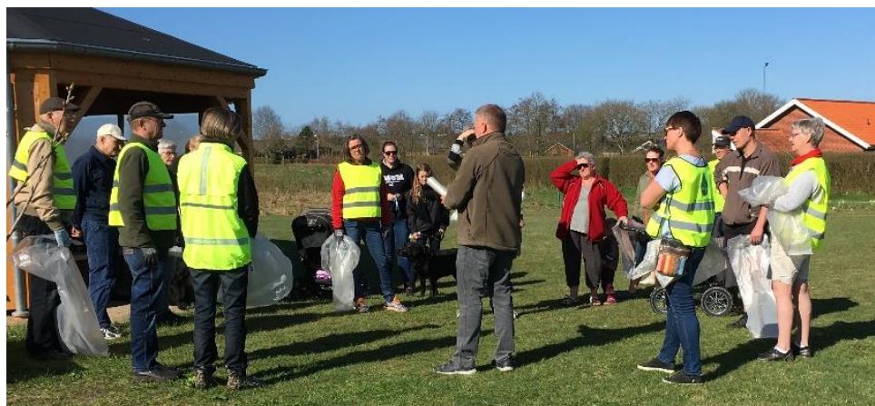
Foto fra affaldsindsamling med Lunde Sogneforening 2018