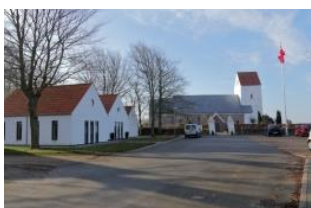
Kirke / kirkehus